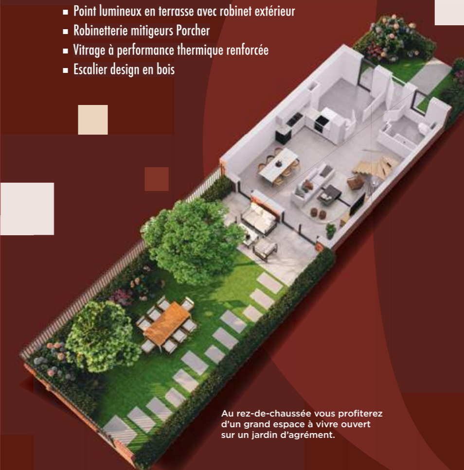
Au rez-de-chaussée vous profiterez d'un grand espace à vivre ouvert sur un jardin d'agrément.