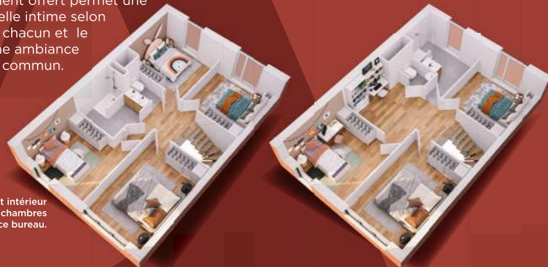
Exemples d'aménagement intérieur avec 4 chambres ou 3 chambres et espace bureau.

Toutes ces variantes sont très utiles selon la composition de la famille, l'âge des enfants, l'organisation de la vie quotidienne. L'aménagement offert permet une vie individuelle intime selon les goûts de chacun et le partage d'une ambiance heureuse en commun.